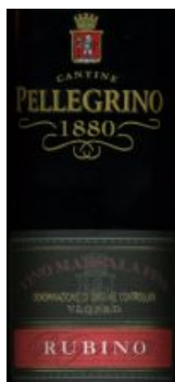
Marsala Fine Rubino DOC Azienda agricola Pellegrino vino dolce